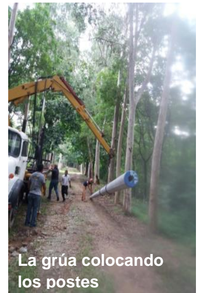
La grúa colocando los postes

campo de juego. Ampliamos el Centro para reuniones y el vivero. También instalamos algunos juegos de patio que nos han regalado ustedes en Miami.