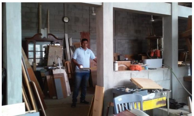
Taller de Carpintería

Todos los trabajos de carpintería, de electrónica, de pintura, de tapicería, etc... que hacemos para reparar los artículos que ustedes nos donan se estaban haciendo en el mismo almacén. Esto generaba desorden e incomodidad. Hemos fabricado cuatro talleres anexos al almacén: carpintería, pintura, electrónicos y tapicería. Esto nos permite hacer un mejor trabajo y con más orden. Estamos proyectando construir dos talleres más... Dios nos ayudará a salir adelante.