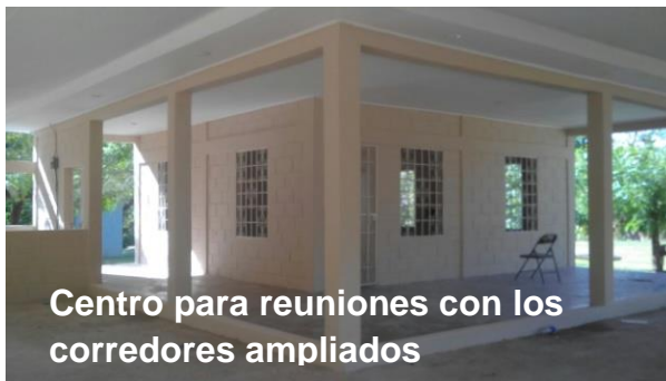
Centro para reuniones con los corredores ampliados