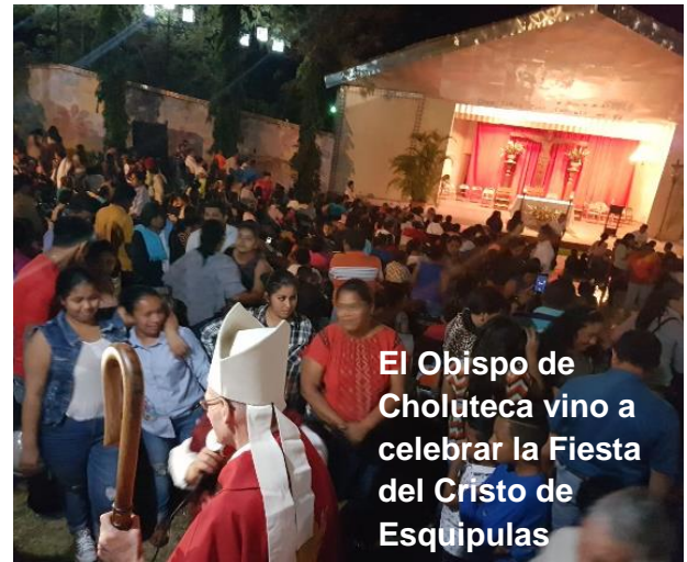
El Obispo de Choluteca vino a celebrar la Fiesta del Cristo de Esquipulas

-La NOVENA del CRISTO de ESQUIPULAS (del 6 al 15 de Enero) fue más concurrida que nunca. El pueblo recurre a Dios para que se calme la violencia y vivamos en paz. Comenzábamos con el ROSARIO de la AURORA a las 6.00 A.M. y teníamos diferentes actividades hasta la EUCARISTÍA a las 7.00 P.M. terminábamos con Danzas Folklóricas y fuegos artificiales. ( aquí no hay fiesta son cohetes... ) Los temas de estudio durante la novena fueron dos recientes cartas del Papa Francisco: “LAUDATO SI” sobre el cuidado de la “casa común” y “AMORIS LAETITIA” sobre el matrimonio y la familia. Fueron días plenos de evangelización y religiosidad popular.