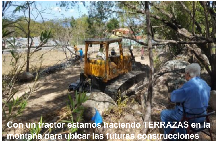
Con un tractor estamos haciendo TERRAZAS en la montaña para ubicar las futuras construcciones

En un caserío llamado "El Banquito" a 30 Kms de Choluteca y a casi 900 mts. de altura; a orillas de la Carretera Panamericana, la Asociación posee un terreno de 2 manzanas. Por su clima ideal ( entre 10 y 15 grados menos que Choluteca ) es un lugar maravilloso para retiros, encuentros, conferencias, fiestas familiares, etc... Lo hemos llamado " Santa María del Rosario ". Como el terreno es montañoso hemos hecho terrazas retenidas con muros de piedra típicos del lugar por la abundancia de